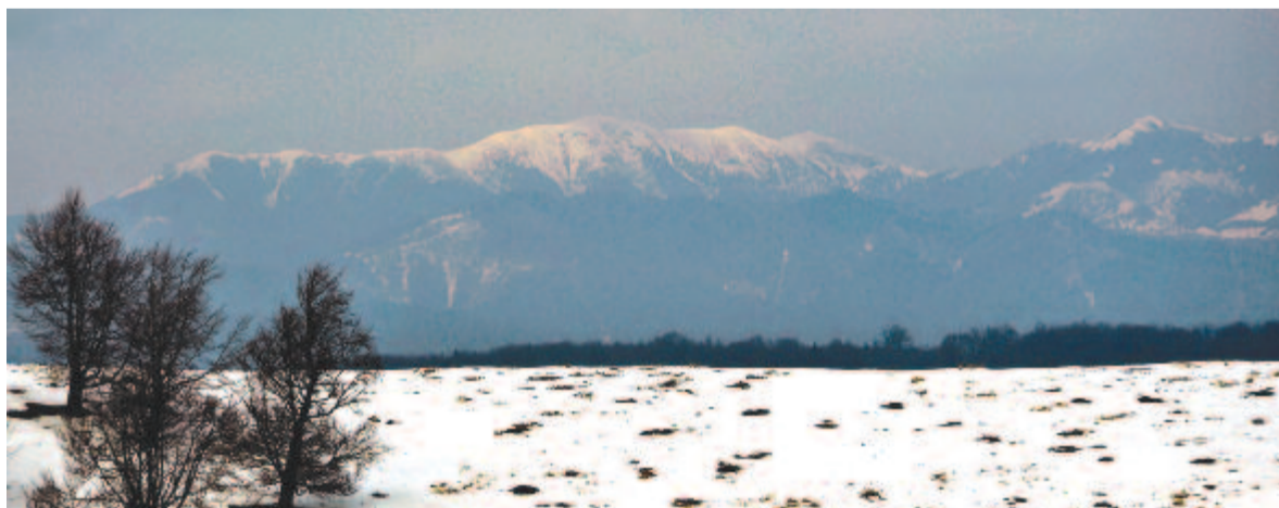
A Kelemen-havasok főgerince a Funtineli-mezőről

Ajánló: Az említett látványosságok mellett érdemes még felkapaszkodni Gödemesterháza Maros-szorosban levő Súlyomkő-sziklára. Csobotány falu hasonló nevű völgyében megtalálhatjuk az egykori (a mostani a főút mellett van) borvíztöltő állomást, és akinek ideje van, egy napot eltölthet a maroshévi egykori Urmánczy-fürdőben. S ha netán július közepén a Maros völgyében van utunk, akkor megállhatunk Ratosnyán a hasonló nevű fesztiválon, ahol megismerkedhetünk a térség népi kultúrájával.