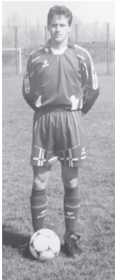
A Marosvásárhelyi ASA felszerelésében a vándorlepteli edzőközpontban

– A jó bor idővel nemesedik, tartja a mondás. Az ön labdarúgói karrierjére is érvényes ez?