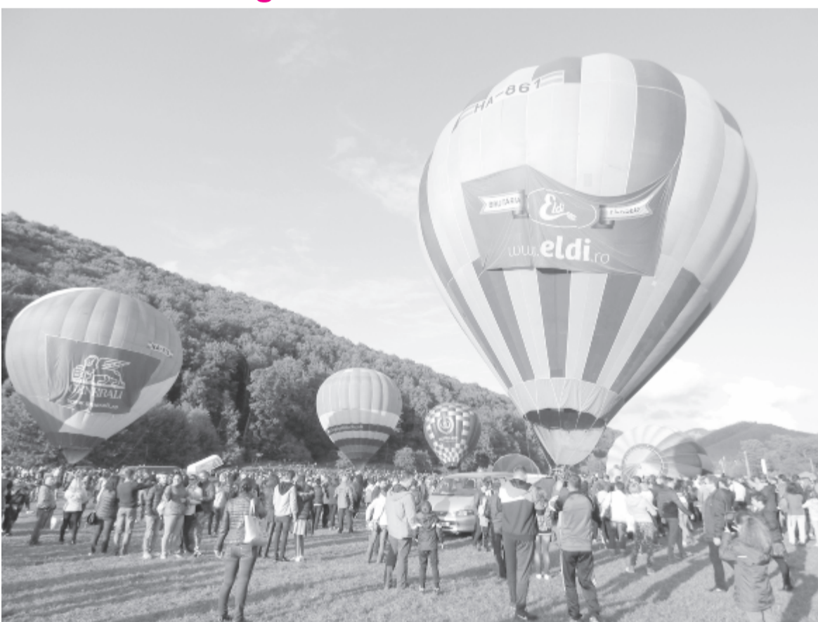
A vasárnapi napsütésben tömeg és léggömbök töltötték be Vármezőt

A vármezői Nyárád Sky Team hat éve alakult, jelenleg négyen alkotják a csapatot – tudtuk meg