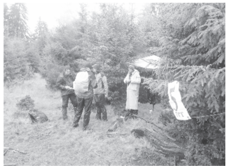
Az 5. ellenőrzőpontnál

A résztvevők teljes névsora a www.ekemvh.ro/teleki – eredmények elérhetőségen olvasható. Fotókat pedig a https://www.facebook.com/ekemvh oldalon találhatóak azok a résztvevők, akiknek nem sikerült menet közben felvételt készíteniük – tájékoztatta lapunkat Pánczél Tibor szervező. ( vajda )