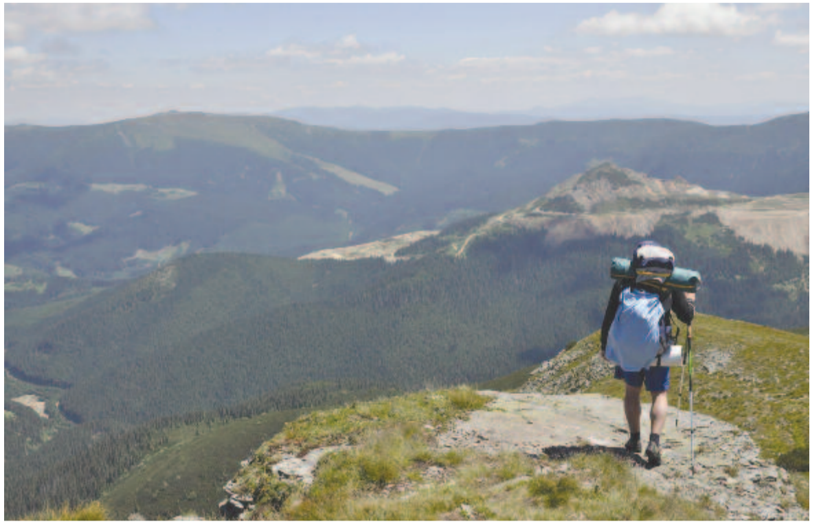
Kilátás a Pietrosz gerincéről

A piros ponttal jelzett útvonal Ratosnyáról indul egy erdőkiter-