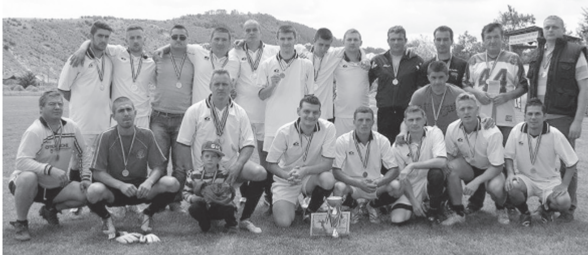
A nyáradremetei csapattal

– Az igazság az, hogy én a komoly sportéletnek köszönhetően rúgom még a bőrt. Jó kis csapatunk van Nyáradremetén, sajnos, helyi gyerekekből nem tudunk egy csapatra való összeverebülválni, de ismerőseimnek köszönhetően Szászrégenből, Szovátáról, Marosvásárhelyről és Nyárádszeredából összeszedtük a tehetséges játékosokat. Olyan csapattársaim is vannak, akik a 2. ligában is megállnák a helyüket, de sajnos, kénytelenek külföldön keresni a megélhetést. Ezért az idény előtt hét játékosból váltunk meg akaratom ellenére, helyükbe tíz tehetséges fiatalot igazoltunk.